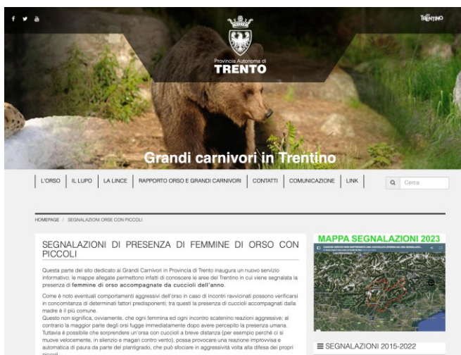
Il portale dedicato a orso e grandi carnivori

Le note informative, i documenti scientifici come gli annuali “ Rapporti grandi carnivori ”, le ordinanze e i decreti del presidente della Provincia sono pubblicati tempestivamente (giorni festivi inclusi) anche sul portale Grandicarnivori.provincia.tn.it. Sullo stesso portale è attiva la mappa che raccoglie le segnalazioni di presenza delle femmine di orso con i piccoli e quella degli orsi muniti di radiocollare. Quest'ultimo - va precisato - è uno strumento impiegato per il monitoraggio degli esemplari problematici e non è in grado di ridurre il rischio. L'utilizzo del collare presenta inoltre criticità e limiti intrinseci allo strumento: l'orso potrebbe sfilarlo (anche per via della naturale perdita di peso invernale) e lo stesso si può danneggiare ad esempio quando il plantigrado si strofina contro i tronchi degli alberi; le batterie peraltro hanno una durata limitata: l'animale va quindi periodicamente ricatturato per la sostituzione del radiocollare.