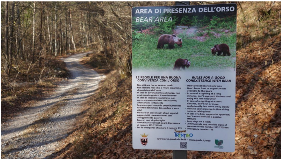
I cartelli presenti sui sentieri

La comunicazione riguardante l'orso e - più in generale - i grandi carnivori in Trentino ha accumulato negli anni una notevole esperienza, testimoniata dalla gran mole di eventi, pubblicazioni, e rapporti scientifici, sussidi didattici, articoli di giornale, prodotti audiovisivi veicolati da radio, tv e social network, cartellonistica, iniziative mirate per i vari target susseguitesi nel corso degli anni. Attività in capo ai Servizi Foreste e Faunistico, con il supporto dell'Ufficio stampa della Provincia. Quest'ultimo, di norma viene attivato nella gestione delle attività di comunicazione al manifestarsi di casi critici, al fine di evitare che si diffondano notizie scorrette o parziali.